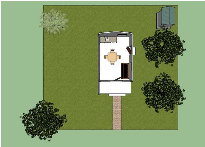
Plan de distribution du noyau de base (core house) comprenant une grande pièce et une galerie