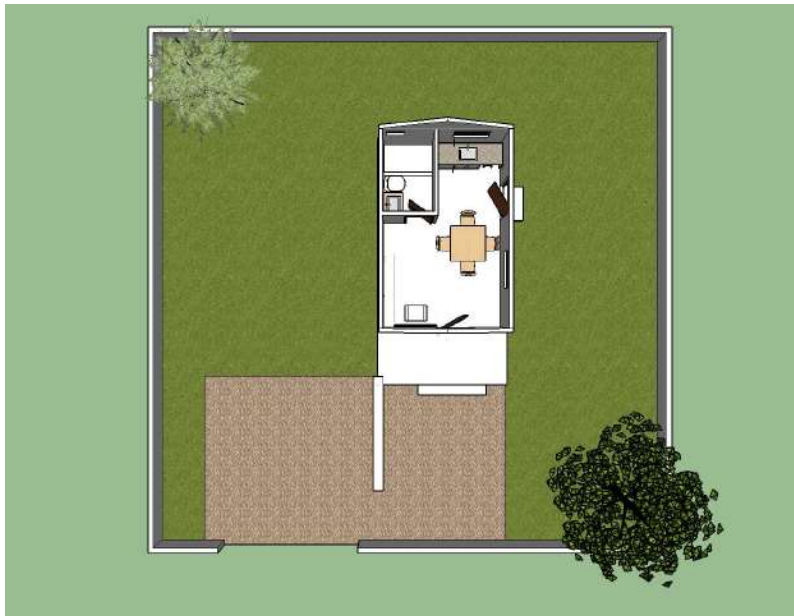
Plan de distribution du noyau de base (core house)