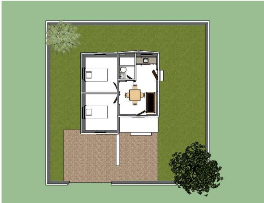
Plan de distribution de la maison complète

Option 1 : Maison de 45 à 50 m 2 comprenant 2 chambres, un séjour, une galerie et une toilette intérieure