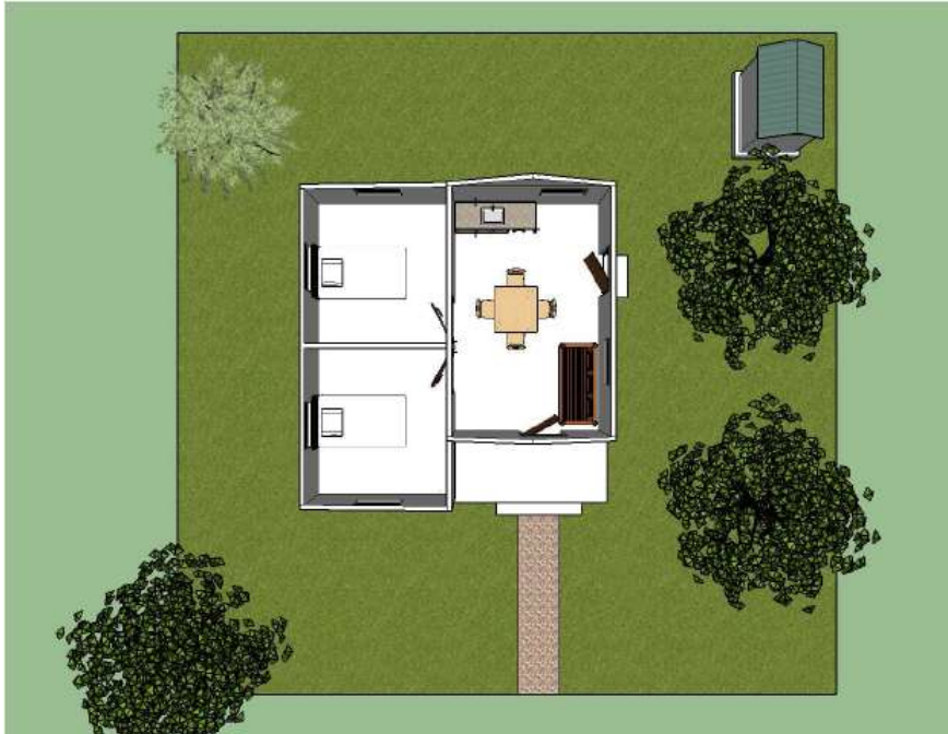
Plan de distribution de la maison complète